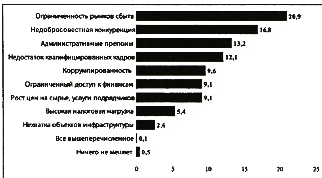
Рисунок – Рейтинг проблем, препятствующих развитию предпринимательства, %

К числу нефинансовой поддержки, принятой в РК, следует отнести сокращение до 30% лицензируемых видов деятельности, сокращение на 30% количества плановых проверок, осуществляемых государственными органами, наделенными контрольными и надзорными функциями, улучшение позиций Казахстана в рейтинге Doing Business ВБ по 11 индикаторам, снижение административных барьеров. О роли и значении проблемы снижения административных барьеров говорит рейтинг проблем, препятствующих развитию предпринимательства (см. рисунок).