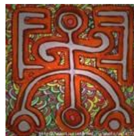
қазақ руларының таңбалары