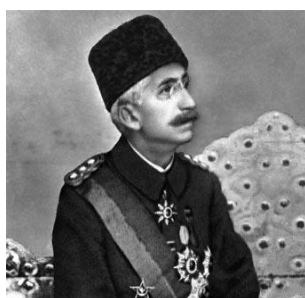
Последний султан Османской империи Мехмед VI (1918-1922 гг.)

Учитель предлагает учащимся рассмотреть две фотографии и ответить на следующие вопросы: