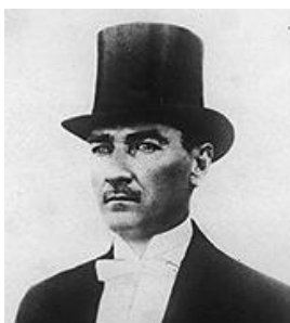
Первый президент Турецкой республики Мустафа Кемаль (1923-1938 гг.)

О каких грандиозных переменах в Турции свидетельствует трансформация образа первого руководителя Турецкой республики? Что могло стать причиной данных перемен?