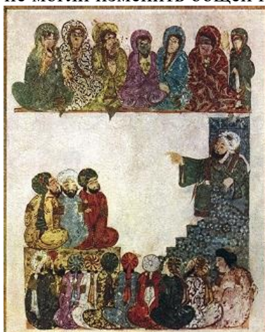
Сцена в мечети. Миниатюра из «Макам» аль-Харири. 13 в.

племенами – «Айям аль-араб» («Дни арабов») (кон. 8 в.) – появились сочинения, выходящие за рамки историч. лит-ры (творчество аль-Джахиза Абу Османа Амра ибн Бахра, Ибн Кутайбы). Вызванное нуждами мусульм. богословия освоение в 9 в. античного и эллинистич. наследия привело в 9–10 вв. к своеобразной «эллинизации» всей А.-м. к. Её первые проявления заметны уже в произведениях аль-Джахиза и Ибн ар-Руми. На основе идей неоплатонизма в лирике аль-Мутанабби и аль-Маарри возникло новое понимание поэтич. творчества, объективно близкое ещё доисламскому восприятию его как «чувствования» и прорицания истины. В поэзии распространились идеи стоицизма, вступившие в конфликт с её традиц. содержанием, что привело к обособлению филос. лирики в творчестве аль-Мутанабби. Завершившееся у аль-Маарри её жанровое оформление означало отрыв от классич. традиции араб. поэзии. Воспевание воинской доблести Абу Фирасом, разработка наследия бади аш-Шарифом ар-Ради, творчество багдадских гедоников рубежа 10–11 вв. не могли изменить общей картины омертвения классич. традиции.