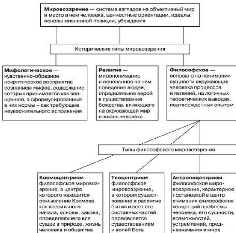
Рис. Мировоззрение и его типы.

Философия аккумулирует накопленные людьми опыт и знания, оказываясь наиболее полным выразителем современной ей культуры. Это происходит путем непосредственного и опосредованного взаимодействия философии с наукой, с искусством, с религией, с повседневной жизнью общества. Философия в определенной мере взаимообусловлена экономикой и характером материального производства, политикой, правом. В ней в концентрированном виде отражается уровень развития отдельной цивилизации и человеческой в целом.