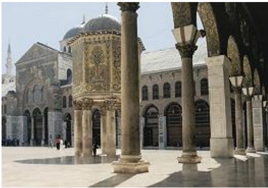
Мечеть Омейядов в Дамаске (Сирия). 707–715.

(См. в ст. Ислам). Употребляемый в научной и популярной литературе термин «арабское искусство» в широком смысле означает искусство араб. стран, начиная с древности, и обобщает достижения ср.-век. изобразит. и прикладного искусства и архитектуры завоеванных и исламизир. арабами регионов Ближнего Востока, Сев. Африки и Юж. Испании. При всей общности худож. процессов, связанных с утверждением и господством исламской идеологии, араб. искусство отмечено существенными различиями худож. стилей и форм, что объясняется культурной спецификой и своеобразием историч. развития каждого региона.