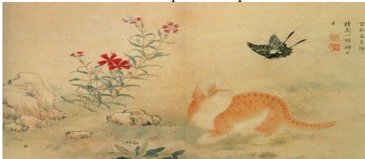
Кот и бабочка. XVIII век. Художник – Ким Дон Хо

Живопись является неотъемлемой частью культуры Кореи. В ней присутствует влияние культуры, но сама по себе она специфична и самобытна. Особый интерес представляет станковая живопись, сформировавшаяся во времена правления династии Чосон. Рисовали на шёлке, бумаге, специальных тканях растительными, минеральными красками или тушью. Если художественная живопись отражала необычное видение мира глазами художника, то народная живопись показывала быт и проблемы повседневной жизни. Можно сказать, что живопись существовала и развивалась в двух направлениях, и оставила за собой бессмертные творения.