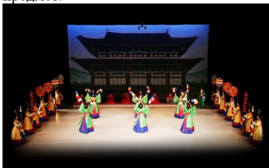
Пакчомму – танец порхающих крыльев бабочки

Издавна, со времён правления династии Корё, в Корее большое значение имел танец. Существует огромное множество традиционных танцев, таких как, танец с мечами, танец с веерами, танец монаха, шута, крестьянина и т.д. Они исполнялись как при дворе императора, так и в деревнях сельские жители устраивали представления. Сейчас танец не является такой важной частью жизни современной Кореи, но существует множество школ, во многих университетах Кореи народный танец преподается как академический предмет.