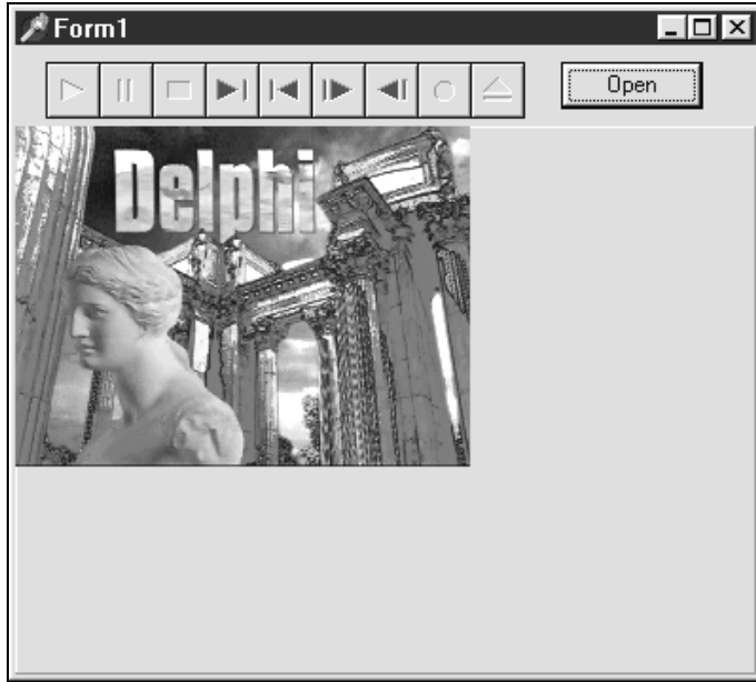
Рис. 1.2. Воспроизведение AVI-файла

На этом мы заканчиваем краткий обзор графических возможностей и переходим к более последовательному изучению графических структур Delphi.